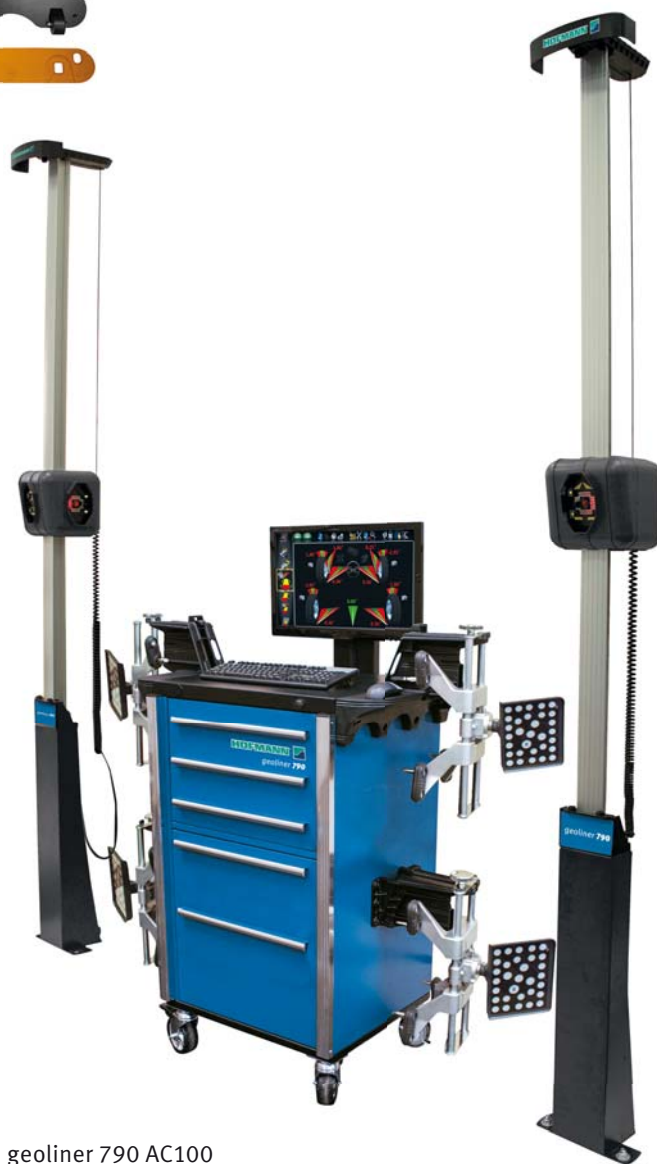
geoliner 790 AC100